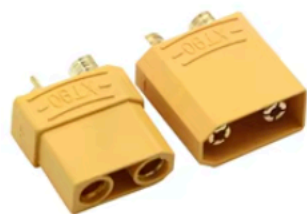
100Pair XT90 Plug

✓ Choice | U-Angel-1988 Specialty Store >